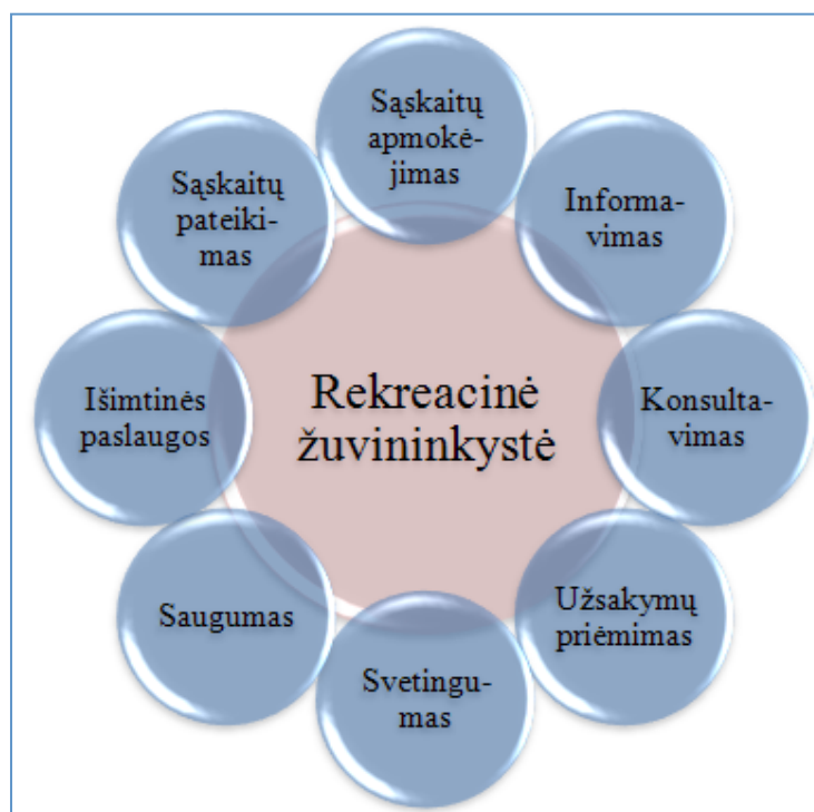
1 pav. Ch. Lovelocko paslaugos gėlės modelis

Remdamiesi juo išnagrinėkite rekreacinės žuvininkystės paslaugą.